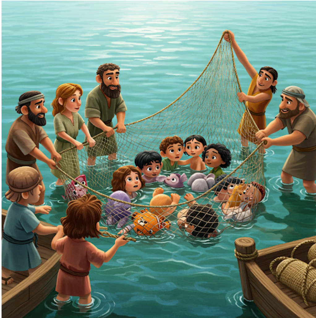
Figuur 4: Marcus 1:17 - 'Ik zal jullie vissers van mensen maken'

De letterlijkheid van de verbeelding hierboven is vaak treffend (vgl. de illustratiewijze van het Utrecht Psalter uit de middeleeuwen).