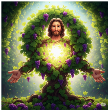
Figuur 1: Johannes 15:1 - 'Ik ben de ware wijnstok'

Een enkel voorbeeld van fascinerende vormgeving. Ik laat de conclusies daarbij aan de lezer.