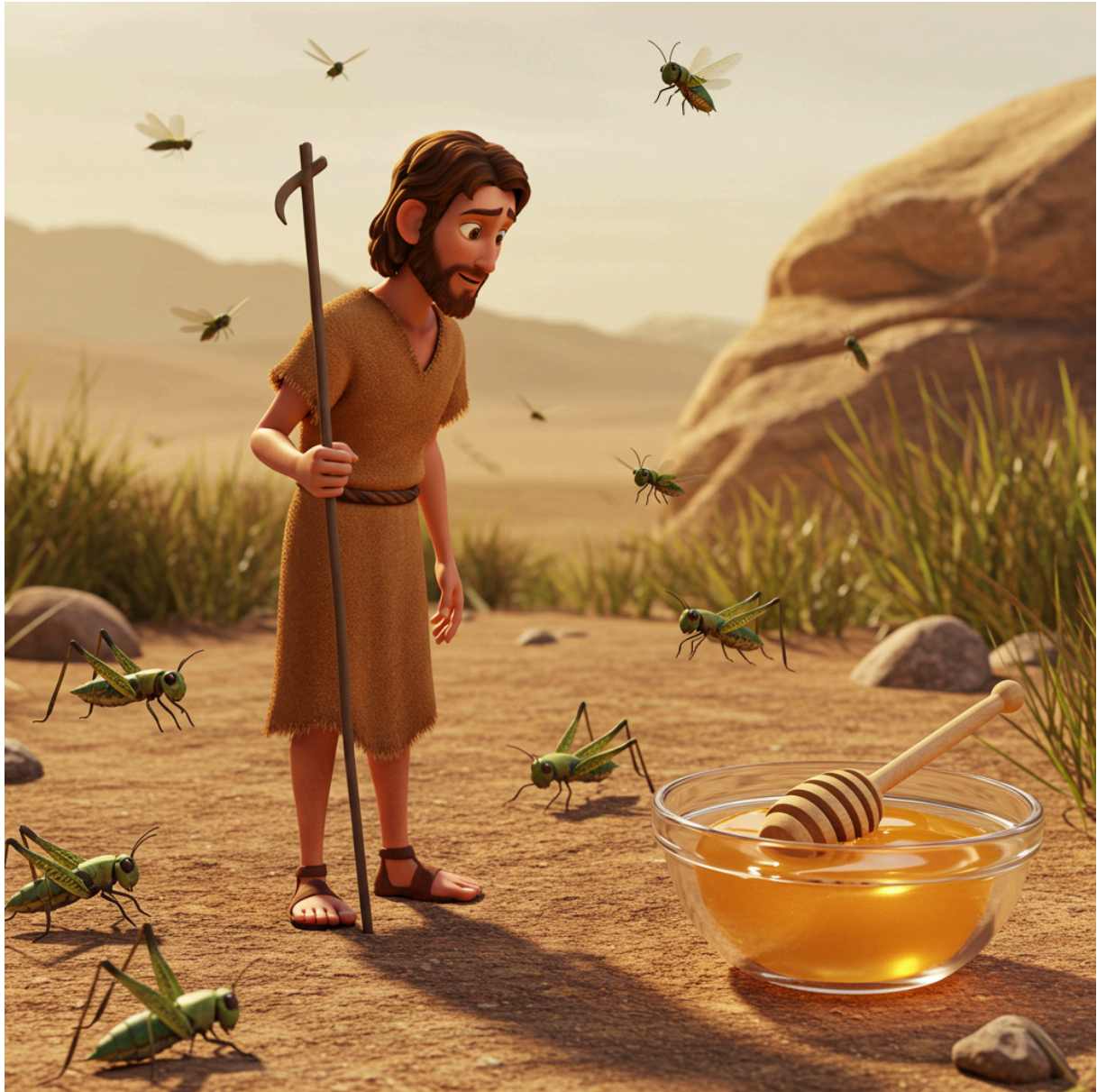
Figuur 3: Marcus 1:6 - De kleding en het dieet van Johannes de Doper