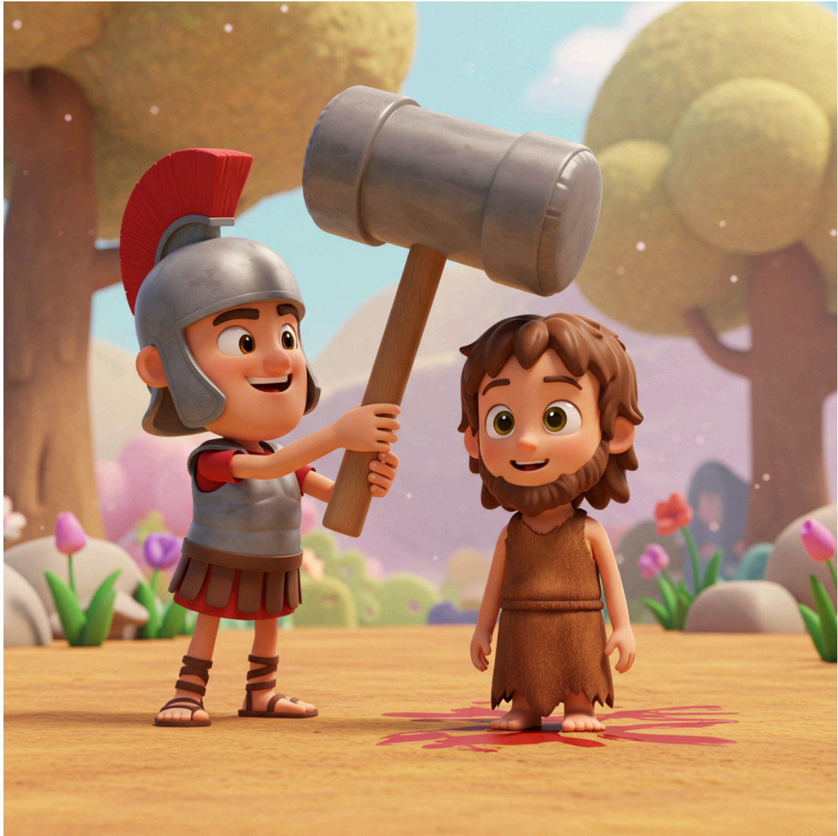
Figuur 5: Markus 6:27b - 'De soldaat ging naar de gevangenis en onthoofdde Johannes'.