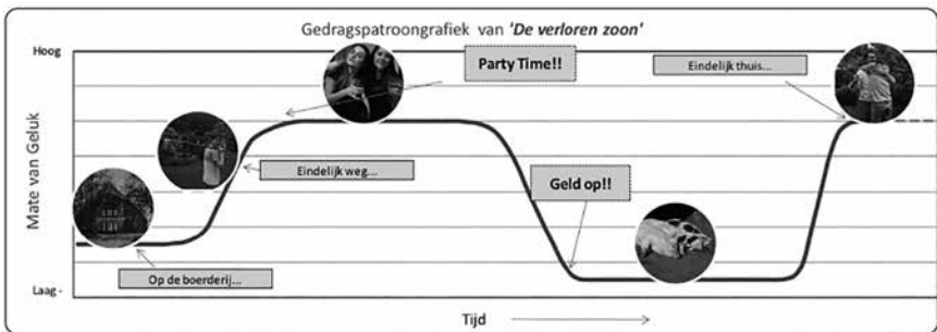
Figuur 1. Gedragspatroongrafiek bij het Bijbelverhaal ‘De verloren zoon’

In mijn onderzoek heb ik gewerkt met het welbekende Bijbelverhaal ‘De verloren zoon’. Figuur 1 is een voorbeeld van een gedragspatroongrafiek zoals deze kan worden gemaakt tijdens het vertellen van dit verhaal. In de grafiek staat op de x-as de tijd, terwijl op de y-as een gevoel of emotie staat, die kan afnemen of toenemen. In het verhaal van de verloren zoon zijn we uitgegaan van de mate van geluk in het leven van de zoon die zijn erfenis opvroeg bij zijn vader en daarmee de wereld introk.